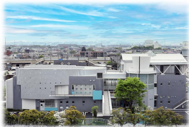
▲ 海老名市立有馬図書館

市内に2館ある市立図書館においても、生涯学習の場としてより多くの市民に利用される図書館を目指し、指定管理者制度により民間のノウハウを活用しながら地域特性を活かした運営を目指します。