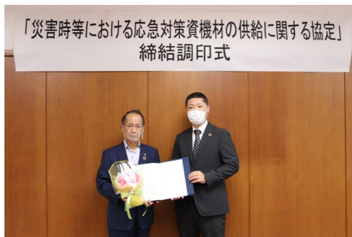
▲左から内野市長、安永代表取締役社長