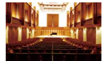
文化会館小ホール