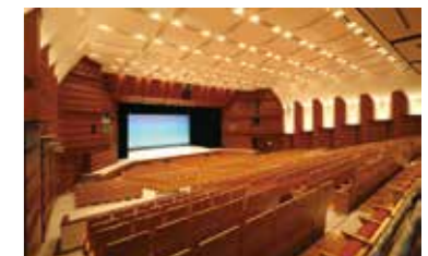
文化会館大ホール

〈市民ギャラリー〉 小田急線・相鉄線「海老名駅」より徒歩約10分 JR相模線「海老名駅」より徒歩約15分