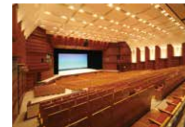
文化会館大ホール

日10日(土)14時~16時 場 一般4,000円 /学生1,000円(25歳以下・当日券のみ・ 要学生証) 他 全席指定 場 文化会館指定 管理者 ☎232-3231