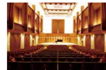
文化会館小ホール

〈文化会館〉 小田急線・相鉄線・JR相模線「海老名駅」より 徒歩約5分 〈市民ギャラリー〉 小田急線・相鉄線「海老名駅」より徒歩約10分 JR相模線「海老名駅」より徒歩約15分