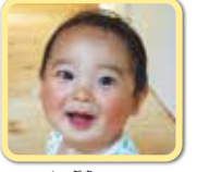
いぶきくん 毎日楽しくしてくれて ありがとう!

次号の発行まで、応募者全員を市ホームページで紹介しています。併せてご覧ください。