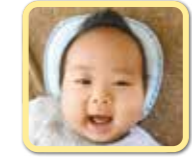
明澄くん お姉ちゃんにそっくり! って言われます☆