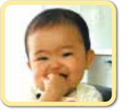
わかちゃん 毎日にこにこ♪ 癒やしをありがとう!