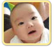
さくらちゃん 元氣いっぱい 大きく育ってます。