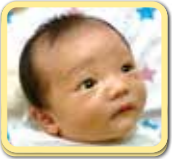
いぶきくん わが家の癒やし! すくすく大きくなっね!