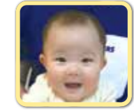
陽南ちゃん 甘えん坊鼻れん坊! 元氣いっぱいひな坊♪