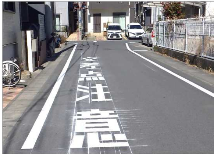
白線・道路標示の塗装