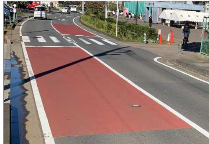
道路のカラー塗装