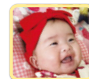
ひーちゃん 生まれてきてくれてありがとう♡