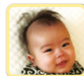
ゆきとくん 今日も かわいいね～!