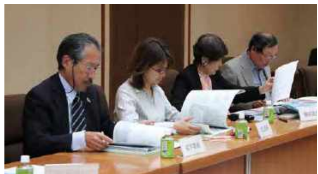
総合計画審議会の様子