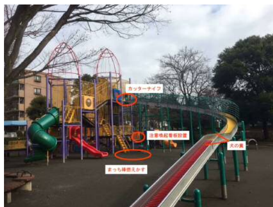
▲大型遊具周辺のいたずらの状況