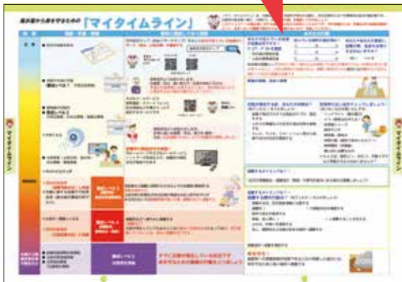
家族構成や生活環境に応じて記入できる