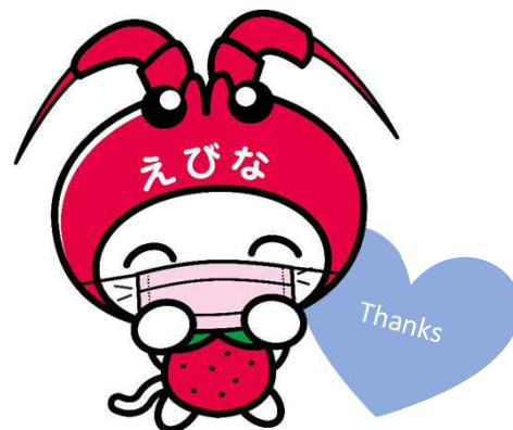
海老名市イメージキャラクターえび～にゃ

また、法務省の人権擁護機関では、不当な差別、偏見、いじめ、名誉棄損等の被害に遭った場合の相談を下記の「みんなの人権110番」等にて受け付けています。困った時は、一人で悩まず相談してください。