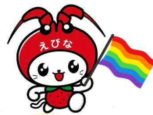
海老名市イメージキャラクターえび～にゃ

相手を笑い者にしたり、否定したりするような言動をしていないでしょうか？まずは性の多様性について、理解を深めましょう。