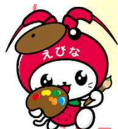
海老名市イメージキャラクターえび～にゃ