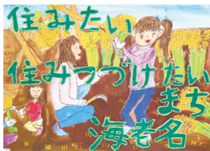
平成30年度応募作品

市内在住の小学生(内)風景・人物など「えびなの好きなところ」を描いたもの(内)作品裏面に応募票を貼付し、市立小学生は夏休みの課題提出日に学校へ提出。その他の方は、8月30日(金)までに、直接または郵送でシタイプロモーション課へ。応募票は市ホームページからダウンロード可(内)作品には、「住みたい 住み続けたい まち海老名」(ひらがな可)を入れる。作品は市の事業やイベントなどで掲示するほか、シタイプロモーションのPRツールとして活用します