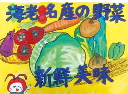
平成30年度小学生高学年の部金賞作品

市内在住の小・中学生(内)「地産地消」をテーマに描いたもの(内)市立小・中学生は夏休みの課題提出日に学校へ提出。その他の方は、9月6日(金)までに、直接または郵送で農政課へ