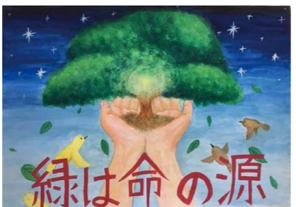
平成30年度小学校6年生の部金賞作品

市内在住の小学生(内)「みどりを育てよう」をテーマに描いたもの(内)市立小学生は夏休みの課題提出日に学校へ提出。その他の方は、9月4日(水)までに、直接または郵送で住宅公園課へ(内)入賞作品は、市役所1階エントランスホールに展示します