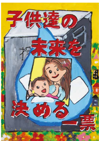
平成30年度小学校高学年の部金賞作品

市内在住の小・中学生(内)市立小・中学生は、夏休みの課題提出日に学校へ提出。その他の方は、9月6日(金)までに、直接または郵送で選挙管理委員会事務局へ(内)作品は、県の「明るい選挙啓発ポスターコンクール」にも応募します