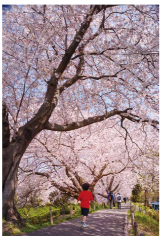
平成30年度花の部金賞作品

市内在住の小学校4年生(内)半紙の上半分は横書きで「えびな」と書いたもの(内)半紙の下半分