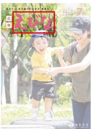
優秀作品は「広報えびな」のタイトルロゴに採用

分に応募票を貼付し、市立小学生は夏休みの課題提出日に学校へ提出。その他の方は、8月30日(金)までに、直接または郵送でシタイプロモーション課へ。応募票は市ホームページからダウンロード可