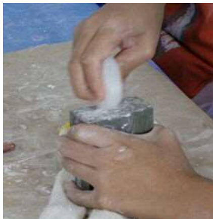
古代人が呪術に使ったといわれている「まが玉」を実物を見ながら自分で作ってみよう！