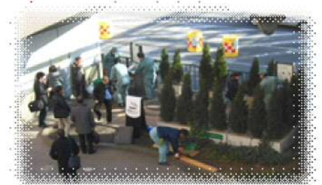
▲海老名駅東口喫煙所の状況