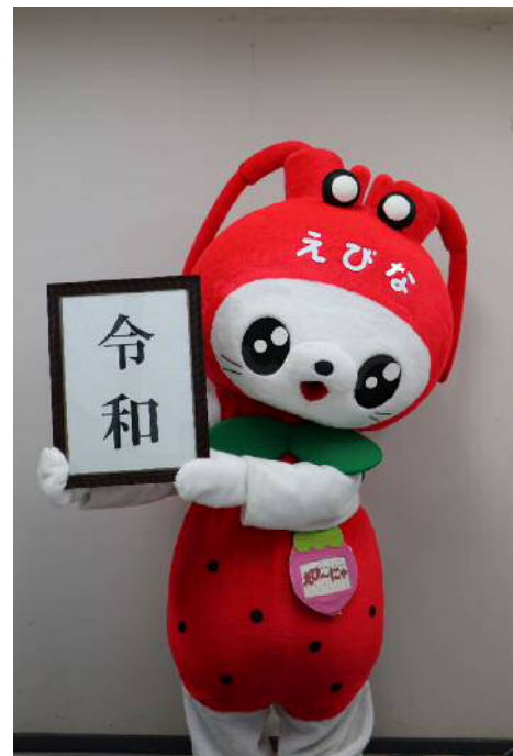
▲えび～にゃ等身大パネルイメージ