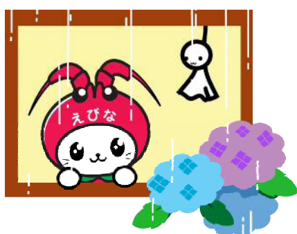
海老名市 イメージキャラクター えび～にや