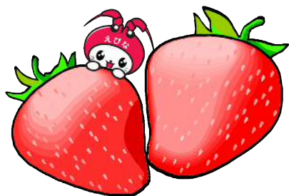
海老名市 イメージキャラクター えび〜にや