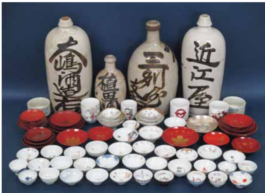
兵役を無事に終えた記念や、長寿などお祝いの際に配られていた記念盃、日常使いの徳利などから、当時の「ハレ」と「ケ」の一場面を垣間見る

晴れの場面(ハレ)で親戚・知人に配られた記念盃や、日常(ケ)で使われた貸し出し用の商店の名入り徳利など、明治から昭和の酒器を展示します。市民の方からの貴重な寄贈品です。