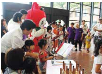
ホワイエには楽器体験コーナーや軽飲食販売もあります