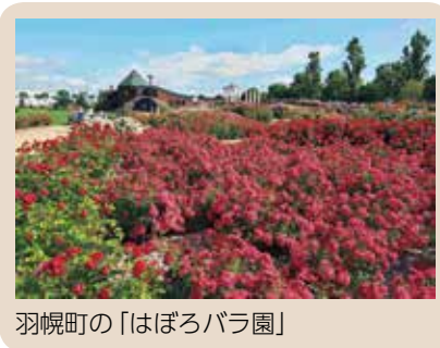
羽幌町の「はぼろバラ園」