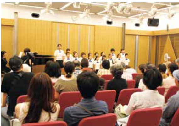
アットホームな雰囲気の120サロン

日9月16日(日)時①11時〜11時20分②11時35分〜11時55分 会場文化会館120サロン 定各回先着20組 費無料 申8月1日(水)から、申込用紙を直接文化スポーツ課へ。電話でも受け付けます。申込用紙は同課で配布のほか、市ホームページからもダウンロードできます