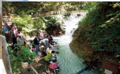
大湯沼川天然足湯