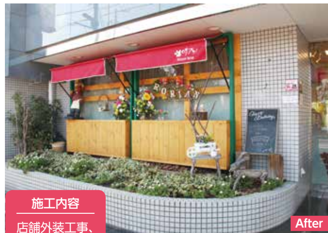
施工内容 店舗外装工事、 看板設置

申海老名商工会議所に事前相談の上、申請書類を直接または郵送で〒243-0403 8めぐみ町6-2同会議所(☎231-5865)へ。申請書類は同会議所で配布のほか、ホームページからダウンロードできます。第1次募集は5月31日(木)必着