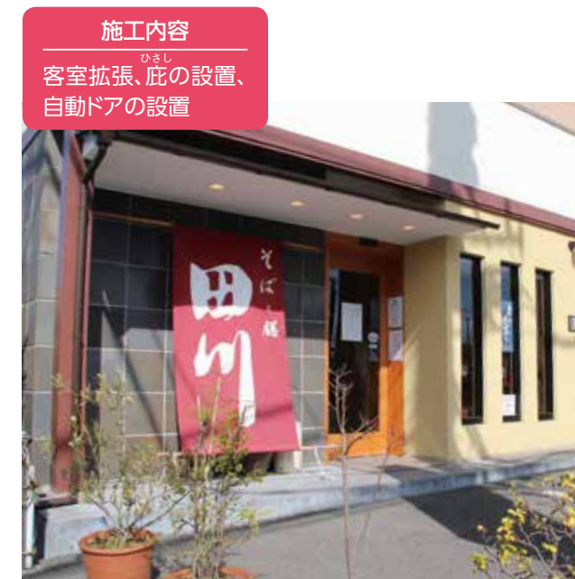
施工内容 客室拡張、 自動ドアの設置