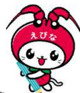
海老名市 イメージキャラクター えび～にゃ