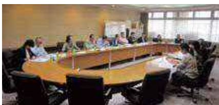
▲外部評価委員会の様子

市民委員は隔年で募集しています。より良い海老名市の実現に参加したいという熱意がある方の応募をお待ちしています。