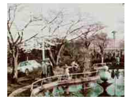
▲清水寺公園(昭和46年春)