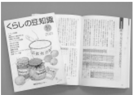
高齢者介護を特集しました

市では、消費生活の安定と向上を図るための小冊子、「暮らしの豆知識2001版」(B6判・295ページ)を作成しました。