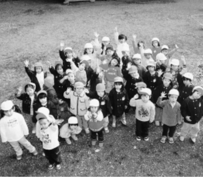
子どもたちも安心して住めるまちへ

ホームページで紹介しています 後期基本計画の詳細は、12月1日から市のホームページ(アドレスは 1面題字右側)に掲載します。 なお、来年3月、後期基本計画書を作成し、主な公共施設等に配置します。