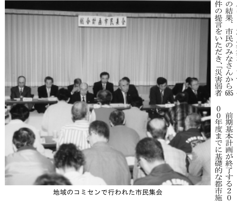
地域のコミセンで行われた市民集会

第三次総合計画後期基本計画を紹介する前にまず、第三次総合計画について説明します。第三次総合計画は、1991年度から2010年度までの20年間にわたる、まちづくりの基本方針を示したもので、市の将来像を表します。基本構想・基本計画・実施計画の三本の柱から構成され(左図参照)、それぞれ位置づけは次の通りです。