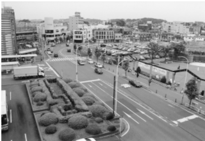
海老名駅周辺に21世紀えびなの顔づくり進めます