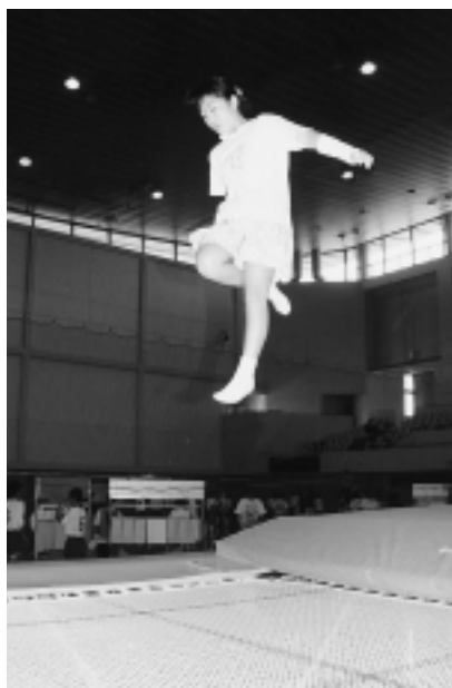
室内でも楽しめます

【全30種目を用意】 ●ストライクゲーム(9枚の的にボールを命中させます) ●トランポリン(子どもも大人も鳥になり楽しい体験をどうぞ) ●一輪車・竹馬・縄跳び・輪投げ遊び(けがに注意して自由に遊んでください) ●体力測定(文部省の新体力測定。74歳までの各年代)ほかに県レクリエーション協会、グラウンドゴルフ、ターゲットバードゴルフ、ペタンク、インディアカ、バウンドテニス、歩け歩け大会(午前8時40分に海老名駅前の中央公園に集合。寒川神社までの13キロを歩きます。途中の海老名運動公園を午前10時に出発しますので、そこ