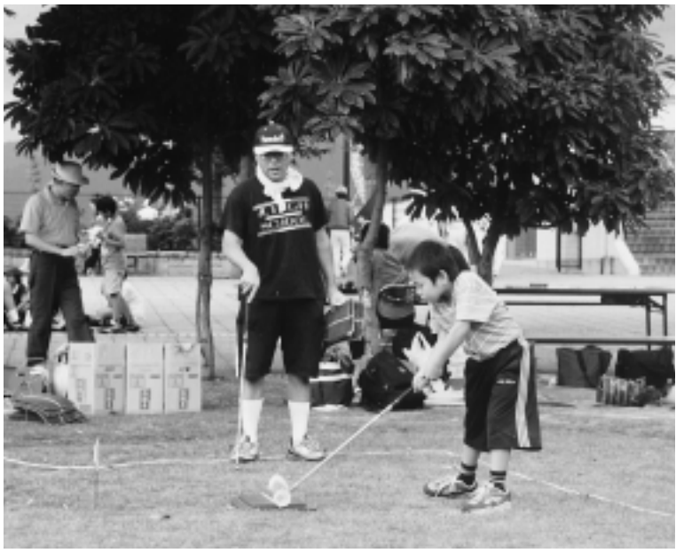
ニュースポーツも体験できます