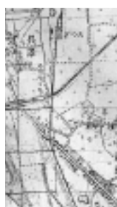
田に囲まれた様子が見られる昭和初期の周辺地図

第461話 郷土の里うた・里ことばなど(五) 寺を詠んだ句 現在海老名市内にある寺院は北部地区十四カ寺、南部地区十六カ寺、計三十カ寺であろう。そのうち、むかしからそれぞれの特徴をとらえ、詠われていた寺が八カ寺ある。それに、昭和五十二年に海老名史跡探勝会が編集、教育委員会監修で市が発行した「郷土かるた」による新句を合わせると、十六句にのぼる。旧作のうち、海源寺を除いた七句は、みな南部地区の寺を対象としたものである。その土地の方が精神的にゆとりがあったのか、関心が深かったのか、はたまた風流人がそろうていたのか、とにかく特異な現象である。 田中ボツチャン海源寺(中新田) 地元をはじめ多くの人はいこう呼んでいるが、「田中ボツチャン海源寺」という人もある。ニュアンスは違いますがどちらも言い得ているとは思いますが、さて海源寺は「新編相模国風土記稿」によると、寛正年間(一四六〇、六五)に当時の大島家の祖・正時が建てた寺で、自邸のほぼ北方百四十メートル先にある所有地を寺域に充てた。東西約九十メートル、南北約百メートルの広大な敷地もろとも、寺が水田中にどっぴり腰を据えたことを詠ったと解する。市内唯一の楼門を有する大寺の風格は、「ボツチャン」ではそのイメージは浮かばないであろう。ちなみに旧厚木町には、「田ん中ちよんぼり長福寺」というのがある。 田に囲まれた様子が見られる昭和初期の周辺地図