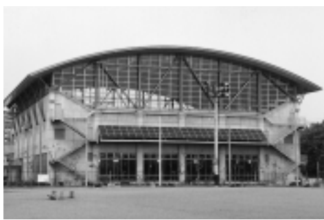
北部体育館の全景

市北部地区のスポーツ拠点として北部公園内(上今泉六丁目14番1号・杉本小学校北側)に建設された北部公園体育館は、鉄筋コンクリート造(一部鉄骨造)で地上3階建。延床面積4705平方メートル。建設費は23億円です。 1階は、屋内プール施設として25メートル5コース(うち3コース可動床、水深0.7メートル・0.9メートル・幼児用プール・ジャグジー・更衣室など。また、トレーニング室215平方メートル、多目的室、管理事務所、備蓄倉庫などが設置されています。 2階は、バスケットボール2面がとれる広さの体育室で、バレーボール、バドミントン、卓球、フットサルなどの競技もできます。また、250席の観覧席(3階部分)も設置されています。 なお、北部公園の体育館は完成しましたが、公園整備は引き続き今年度も行い、テニスコート3面(砂入り人工芝、親水広場工事など)を実施。全体整備の完成を平成13年3月に予定しています。しばらくの間、利用者みなさんにはご迷惑をおかけします。なお、駐車場も工事中のため、車での来園はご遠慮ください。