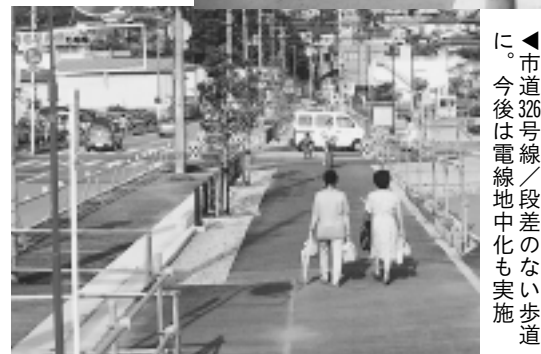
市道326号線/段差のない歩道に。今後は電線地中化も実施