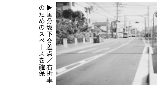
国分坂下交差点/右折車のためのスペースを確保

海老名駅入口交差点は、1日の車の交通量が約1万3000台と、市内で最も多いところで、歩行者の安全確保と渋滞解消が課題となっています。このため、今年度から県と共同で右折レーンの設置に向けた事業に取り組みます。