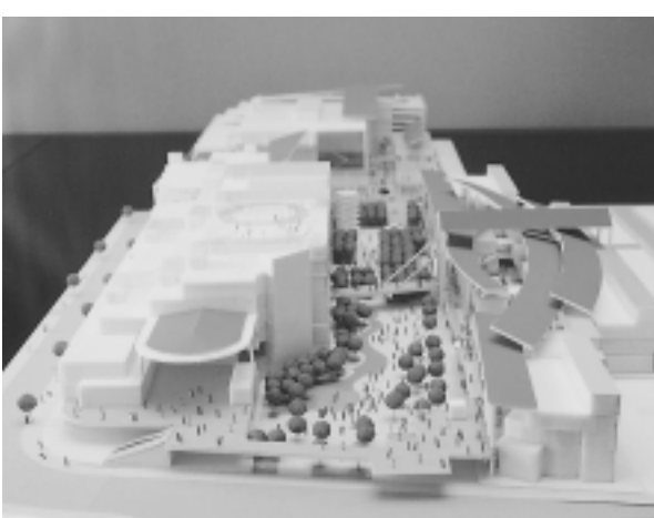
海老名駅東口から見た中央公園周辺開発の完成模型

り、ぶらぶら過ごせる空間づくりとなっています。具体的には、駅前の自由通路(歩行者の高架道路)とつながる総延長約800mの「ランプリングテラス」(公共通路)を、中央公園を取り囲むように配置。これにより公園周辺を一体化させることで、人びとが集い、憩える空間を確保します。さらにその周囲に百貨店の「丸井」を核に、シネマコンプレックス(映画館、物販飲食専門店、各種サービス施設などで構成する複合型商業施設)を建設する予定です。工期は、平成13年1月着工、14年2月の開業を目指しています。