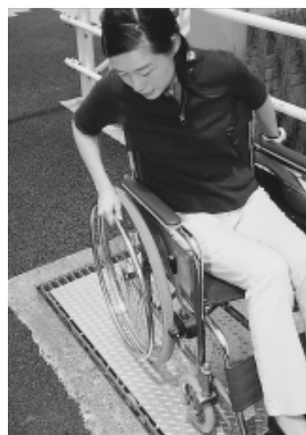
市役所北側などに設置の車いす歩行しやすいすべた