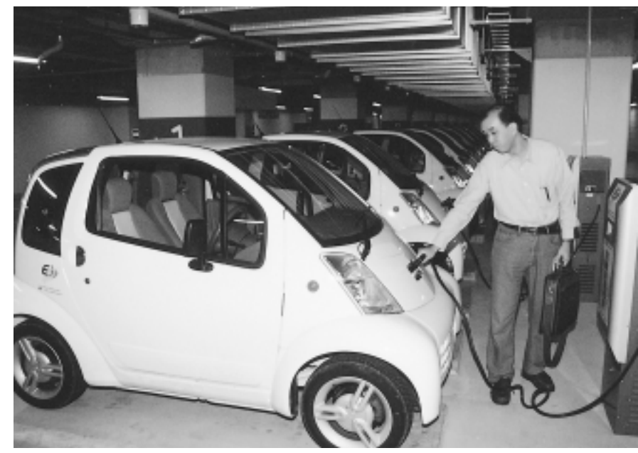
車の受け渡しは中央公園地下駐車場で