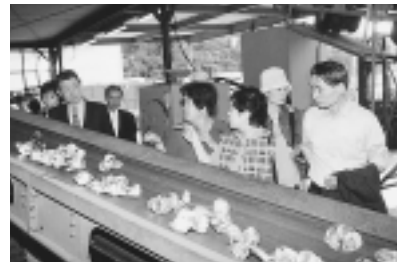
空き缶の処理に見入るモニター

のころ見たり使ったりした、かまど・たらい・お手玉など、懐かしいものばかりでした。続いて訪れた消防署では、消防の仕組みについての説明後、希望者ははしご車に乗る体験をしました。通信司令室は、119番通報を受信し瞬時に出勤できる