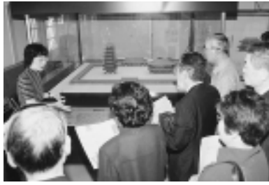
復元模型を前に国分寺の説明

▽問い合わせ 海老名商工会議所内銘酒開発委員会(☎231・5865)または商工課(内512)。