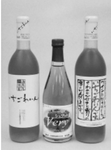
シュワットVery(中央)といちごわいん(右が「特選」)

市内特産品のいちごわいんに新しい仲間が加わりました。その名も「シュワットVery(ベリー)」。いちごわいんの甘さと風味に炭酸を加えた、スパークリングワインです。名前は、泡