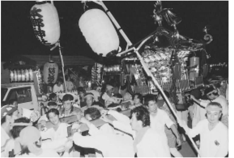
かけ声も高らかに、華やかに去年はみこしも花を添えて...