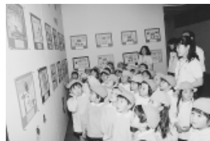
チビッ子画伯の傑作をどうぞ(去年の会場)

必ず本人が行ってください 調整会後の空白については、利用月の1カ月前から体育課で受け付けます ▽問い合わせ 体育課(内676)