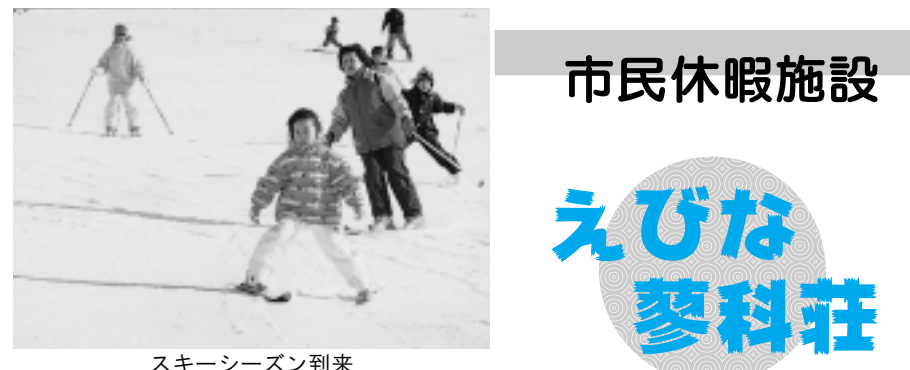
スキーシーズン到来