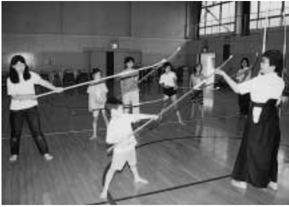
なぎなた教室の様子

青少年会館では、市内在住、在勤、在学の方を対象とした平成13年度第3期主催講座の受講者を募集します(下表参照)。この講座は、趣味を広げたり技術を習得できることから、毎回好評を得ています。 ■ 11月2日(金)から開講日の前日まで、電話または直接青少年会館へ。先着順で、定員になり次第締め切ります。