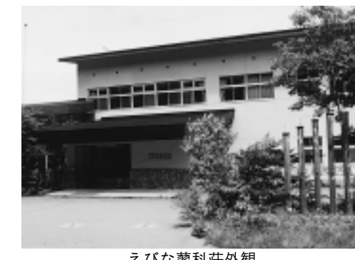
えびな蓼科荘外観

長野県北佐久郡立科町にある「えびな蓼科荘」は、白樺高原の豊かな自然を満喫できる市民休暇施設として、多くのみなさんに利用されています。「えびな蓼科荘」を利用する場合は、あらかじめ空室状況を確認し、直接市民活動課へ申し込んでください。電話での予約はできません(空室状況は問い合わせできます)。予約期間は、利用日の3カ月前の同日(閉庁日)に当たる場合はその翌日から、5日前(閉庁日)に当たる場合はその前日、までです。平日の午前8時30分から午後5時の間受け付けていますので、宿泊料をご用います。市民活動課で手続きをしてください。なお、空室状況は海老名市ホームページ(アドレスは1面電子右側を参照)でも確認できます。市民活動課(内2)へ。