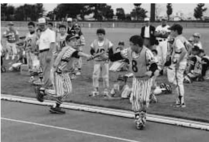
チームで世界記録に挑戦だ!