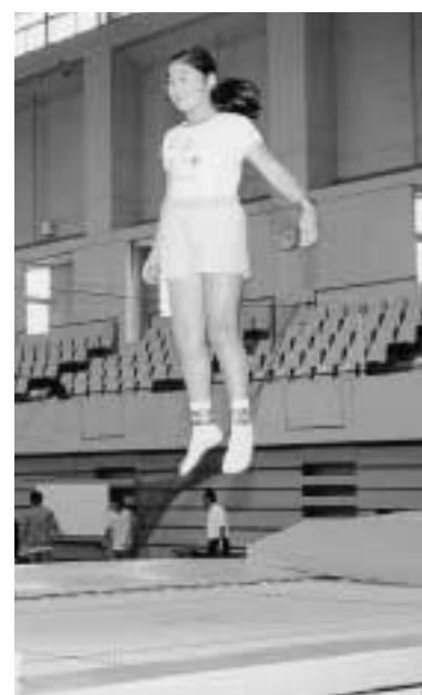
トランポリンも体験できる

トルバスで来場してください。 ▼チャレンジ種目 参加された方には、記録証をお渡しします。 ●エースをねらえー(テニス サイフコンテスト) ●豪球一直線(野球スピードガンコンテスト) ●強肩三球勝負(ソフトボール下手投げ遠投コンテスト) ●エーストライカー(サッカーの当りコンテスト) ●フリッピーゲーム(トリスビーの当りコンテスト) ●一輪車競走大会 ●輪投げ大会