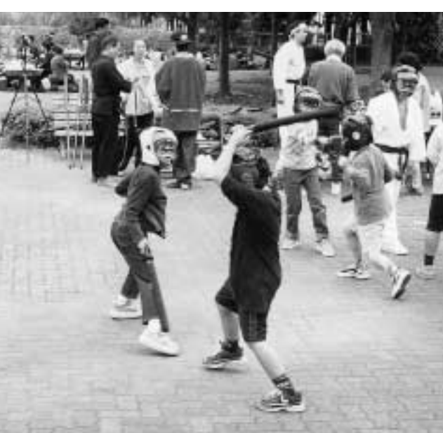
ニュースポーツのひとつ「スポーツチャンバラ」