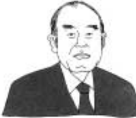
孫・なんでこんなに

思いつくままに 2、3年前だったと思いますが、「孫」という歌がヒットしました。 当時、私はまだ孫がいなかったのですが、テレビで「孫・なんでこんなに」を見て、孫のかわいさメモロメロのメロディも歌詞も「そんなもんかよ!」という程度でしか聞いてはいませんでした。が、昨年の12月に、遅まきながら、私も孫を持つ身となりました。このことは、昨年10