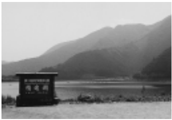
施設周辺の精進湖畔

富士のすそ野にある「富士ふれあいの森」周辺は、精進湖、本栖湖などの湖や氷穴・風穴などの雄大な自然に恵まれています。市内の小・中学校利用日以外は、市民の方などが利用できます。貸出物品も充実しており、キャンプ初心者の方も安心して泊まれます。