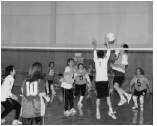
種目のひとつソフトバレーボール

バドミントンのコートで、軟らかいゴムボールを使う4人制のバレーボールです。どなたでも楽しめます。▼部門 小学生、レディース、一般男女混合を含む)の3部門。ただし、応募状況により部門の変更もあります ▼構成 1チーム5〜6人程度で構成の24チーム程度 ③リレーマラソン