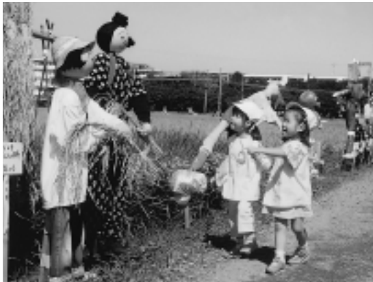
1周年を迎え、9月の木工教室で製作した看板も設置

場所 中新田かかしまつり会場 撮影日 9月20日 国分寺台在住 坂本喜一郎さん撮影