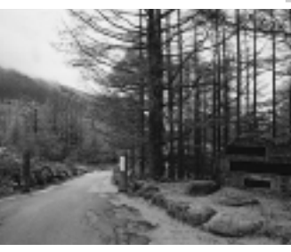
紅葉の見所 御泉水自然園

長野県北佐久郡立科町にある「えびな蓼科荘」は、白樺高原の豊かな自然を満喫できる市民休暇施設です。