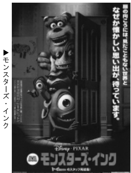
▶ モンスターズ・インク