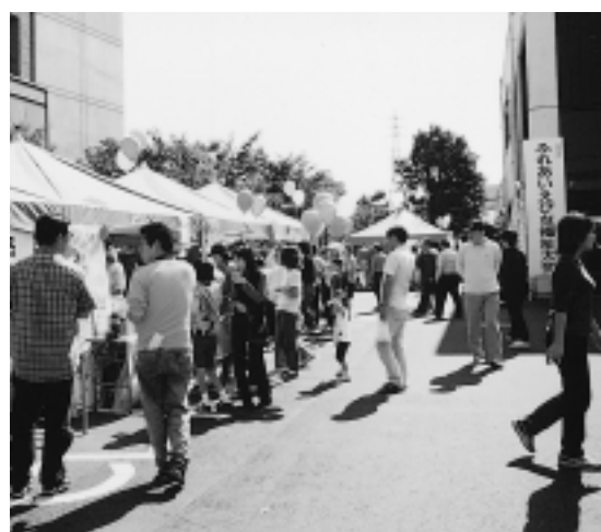
模擬店も連なりにぎやかに(去年)