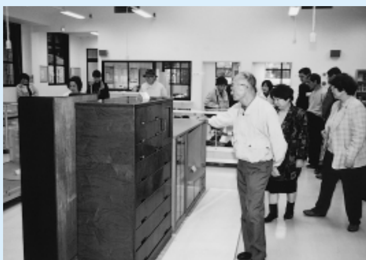
▲ 集団広聴事業の一環として行われている「施設めぐり」(1) サイクルプラザで