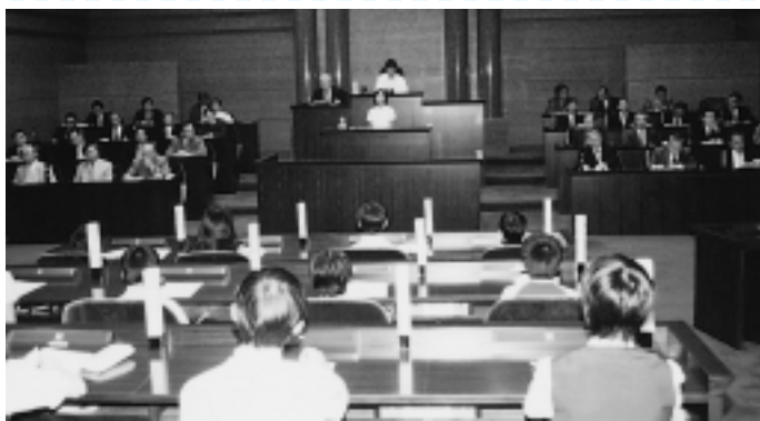
市内小中学校の19代表議員 まちづくりで質疑

市内の小中学校代表の19人が「議員」になり、海老名のまちづくりについて意見交換と質問を行う「海老名こども議会」が、8月26日、市議会議場で行われました。