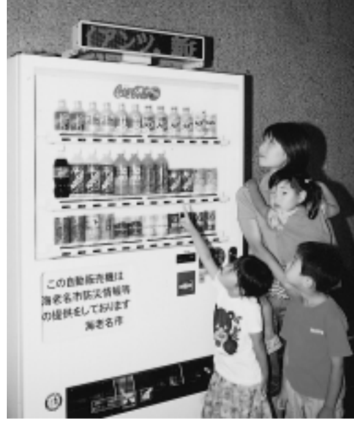
普段はニュースが表示されます