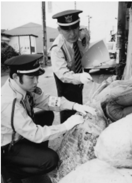
きびしくチェックするパトロール隊員(社家で)

このため市では、7月1日から 不法投棄されやすい場所などから市内のごみの不法投棄場所や 監視・巡回して、不法投棄の抑