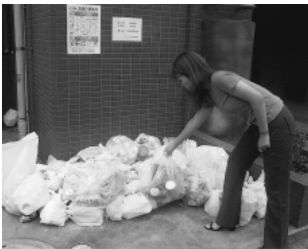
ごみ集積所は、ルールを守って整然と...