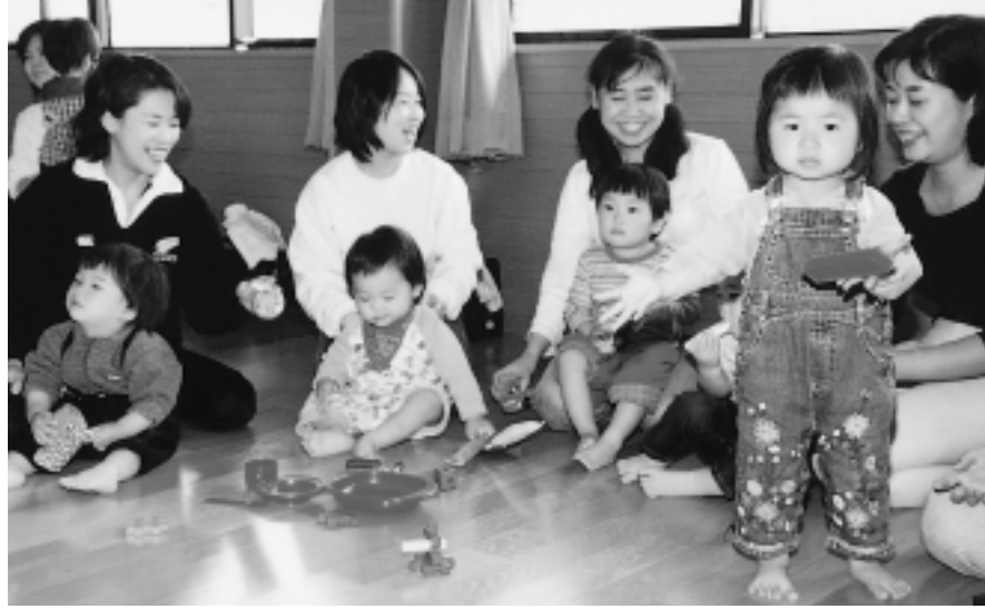
図 アンケート結果も詳しく掲載 同書には、計画策定にあたり

去年9月～12月に実施した、「子どもの生活・育児状況」と「保育ニーズ」に関するアンケートの結果も掲載しています。これは、4カ月児健康診査などの母子保健事業や子育て支援センターの「すくすくサロン」＝写真などに参加した子の保護者、市内保育園に通っている児童の保護者など約1500人回答率69.4%を対象に行われたものです。