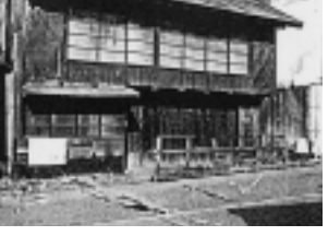
「桜屋」(昭和57年12月13日撮影) 同44年解体

さあ大変 馬が小便 渡し船 「新編相模国風土記稿」の河原口村の項に、「当村及厚木・中新田三村の持船五艘を置て往來に便す」とある。その舟の中の珍事。別に「馬船」といって、馬とその車専用の舟があったのに。これは、馬の放尿のしぶきを浴びた人に思いを寄せた、ユーモアに富んだ川柳である。その一人前の船頭さんになるには年期が要ったため、棹で三年 櫓で三月 という里ことばが生まれている。竹棹一本で心技一体、自在に船を操る難しさをよく表現していると思う。 浮世苦勞は相模の川へ 水に流して共稼ぎ これは甚句(七・七・七・五の四句からなる民謡)、夫婦愛が感じられる。甚句から、賑やかなギッチョんチョン節に転換した、次の歌もある。 相模川さえ棹さしや届く ギッチョんギッチョんギッチョんチョン なせに届かぬわが思い オヤマカドッコイドッコイヨウイヤナア ギッチョんギッチョんギッチョんチョン 同じ節で、相模川にも棲むかよ船が 私の胸にも鯉が棲む」という歌詞もある。 次は明治中後期、花柳の巻めく国分宿に関するもの。二十そうしを越しながら 金も含まぬ恥ずかしさ 最盛期には料亭が十一軒もあり、女性従業員四十人と