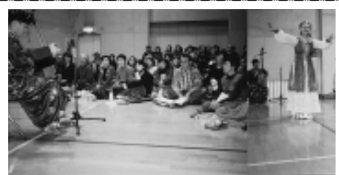
馬頭琴とモンゴル舞踏堪能

12月16日、上今泉コミセンで「馬頭琴とモンゴル舞踏鑑賞の集い(上今泉連合自治会主催)」が開催されました。160人を超える人が来場し、本場の演奏と舞踏を堪能しました。