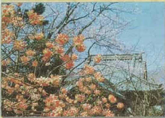
満開のミツマタの花