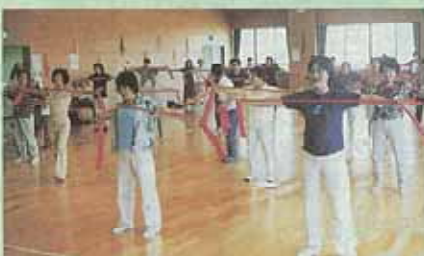
ゴムバンドを使った海老名のびのび体操

▼費用 食材費200円 ▼お問い合わせは直接保健相談センター(☎235・7880)。