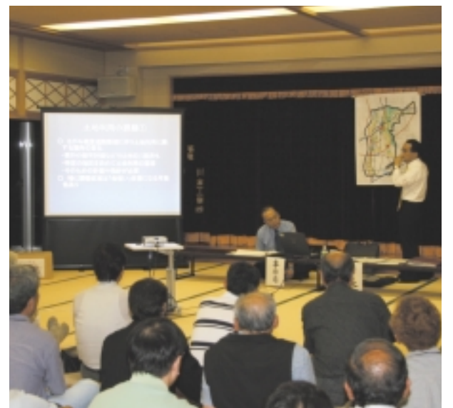
▲昨年のタウンミーティングの様子

※手話通訳・保育を希望する方は、各開催日の10日前までに企画政策課へ電話でお申し込みください。(申し込みがない場合、手話通訳・保育は行いませんのでご了承ください)