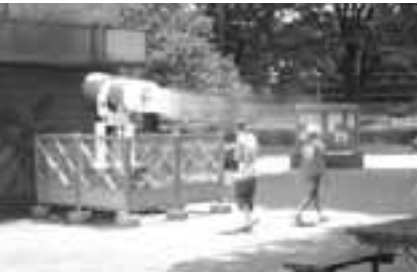
▲ 設置例。マイナス3～6度という高い冷却効果が期待できます

です。霧の粒子は非常に細かいため、体に当たっても濡れる心配がないほか、消費電力はエアコンの約20分の1という高い省エネ効果があり、「人にも自然にも優しい」設計となっています。稼働期間などは次のとおりです。 ▽期間・時間 7月18日(土)9月30日(金)の9時～16時